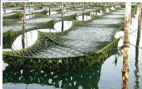
あおさ養殖の網張り体験