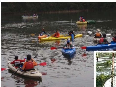
シーカヤックに乗ってアサリの放流

※活動終了後に、アサリとあおさの味噌汁を用意しますので、昼食をご持参いただいても結構です。