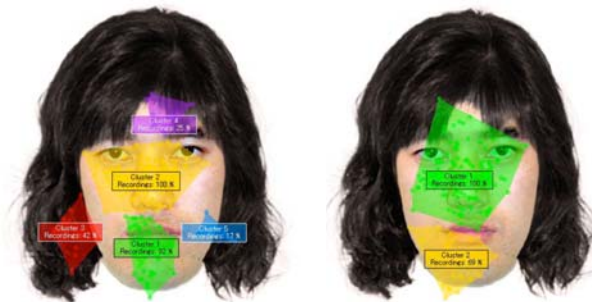
図1 顔刺激への停留回数と停留時間を視覚的表現の例

③方法：パソコンで髪の毛を合成した短い男性髪をした男性と女性、長い女性髪をした男性と女性、髪を隠した男性と女性の写真を計12枚モニタに1枚ずつ提示し、写真の性別判断を行わせた。その際の視線情報を眼球運動測定装置で記録した。図1は、視線情報(刺激への注視時間と注視回数)を視覚的に表した図の例であり、円の中心に記述されている番号は注視回数と順番を、円の大きさは注視時間を表している。