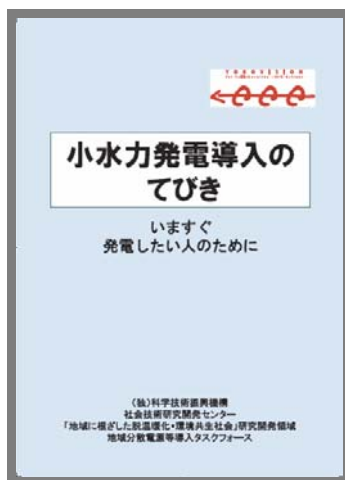
図3 発行した小水力マニュアル

小水力導入マニュアルはこれまでも多々あったが、小水力発電が脚光を浴びている今、全く知識のない者でも簡単に理解でき、かつ地域の力、とくに地域に潜在する知恵や技能や技術の活用、多様な人材との連携で行う「地域に根ざした小水力利用」という観点でのマニュアルはなかった。領域における複数プロジェクト横断型の「地域分散電源等導入タスクフォース」と連携し、このような観点からの小水力導入マニュアル「小水力導入のてびきーいますぐ発電したい人のために」（図3）を21年度～22年度にかけて取りまとめた。さらに、この成果を幅広く活用してもらうために、小水力の魅力や歴史などの解説を加え、出版物として発行した 4 。今後は、関係法令の解釈の緩和・修正等の迅速な反映や対応が課題となる。